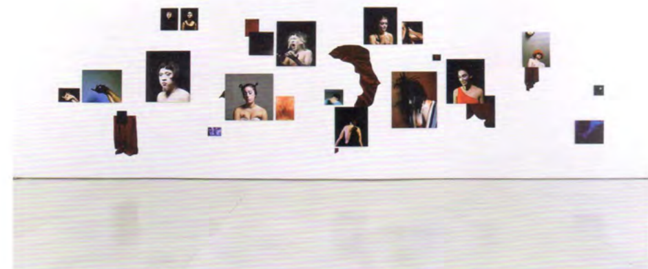
《多嘴的人》860×280cm 喷墨打印 2012年

在刘诗园的艺术实践中一直在避免对于摄影与行为这两种可能性的明确,也可以表达为避免“一句话”的简单陈述,她是在实践一个在这两者边界线模糊过程中的新的实践语境。刘诗园同时一直在做对于图像边界线的表达与陈述,传达的不仅仅是对于图像本身内容的理解,是能达到对于图像心理与图像构成的探讨,并且打破一种惯有的观看规则。她把自己比作把种子撒到地里的人,“至于种子怎么长出来,长成什么样子,我只起到一个扶持作用。我是我作品的助手。”刘诗园创作过程当中更多注重的是一种天时地利人和。在她自己的归纳中,她把自己的创作分成两部分,一部分是有意识的,一部分是无意识的,这两部分是相辅相成同时发生的。“我的生活方式、我的处事方式永远是站在边界线上的,有意识与无意识这两部分同时发生,我也肯定是站在有意识和无意识的边界线上也才能找到模糊和摇摆不确定性。这种有意识是我所拥有的知识、我所受到的教育、我读的书、我写的东西、我的理解、我的艺术实践,另外的无意识也就是所谓的天时地利人和。”刘诗园正是在这两者之间不断的尝试、克服。