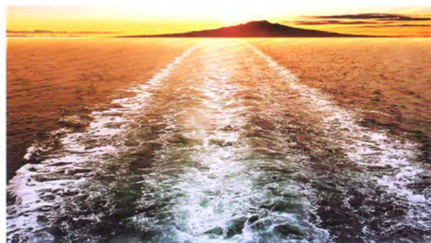
上下:《视线的边缘,或大地的边缘》截图 单频影像 6'00" 2013年

作本身的还原。但是《Hi-!》是在记录现实所发生的事件。图像本身具有当前时间的指向性,在它呈现出来的时候,我们首先看到的是它的现象和形式,但有跨越的延续或非延续的引申作用,同时附着着不确定性的关联因素。图像本身或内容,总是象征着一种行为,这也决定于你作用于图像的行为关系。图像也总是发生在当前时间的形式表面与这种行