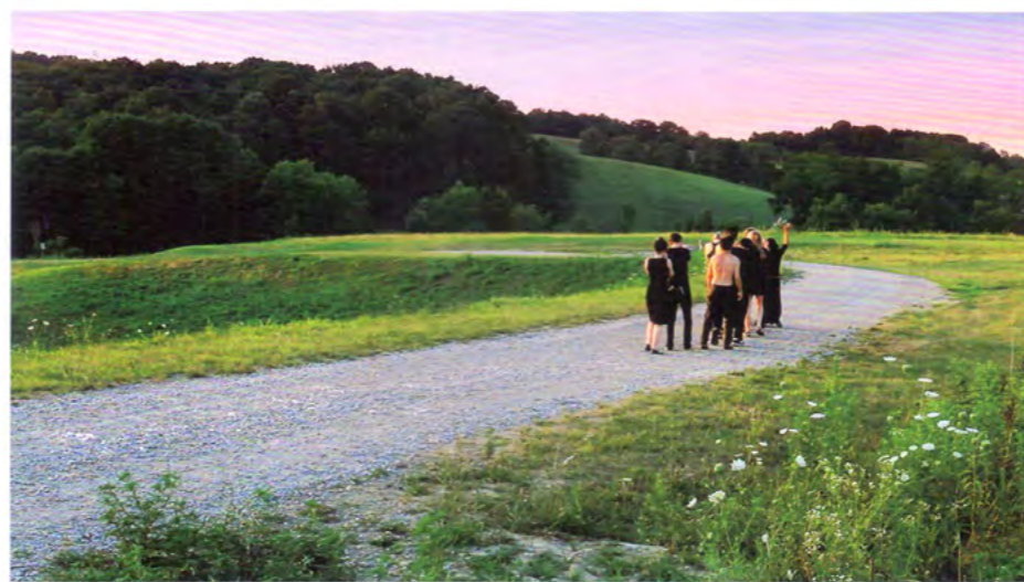
《视线的边缘,或大地的边缘》截图 单频影像 6'00" 2013年

《也可以不是》和《做戏》是刘诗园关于物体的边缘线与二维、三维关系的持续的探讨。《多嘴的人》在深圳双年展展出之后,刘诗园又受到了OCT当代艺术中心主办的第七期国际艺术家工作室的邀请,《也可以不是》是刘诗园提文的驻场方案,之后在驻留过程中延伸出了作品《做戏》。这两件作品带有一种隐性的调侃。在《做戏》中我们能直接的感受一种美的反差,平面化的美的做工,对于珠宝的特性,刘诗园透过表面