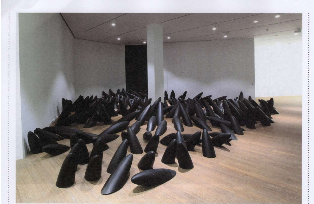
徐文恺 (aajiao), 《枯山水》, 海绵和金属, 尺寸各异, 2014, 上海二十一世纪民生美术馆 | 图片提供