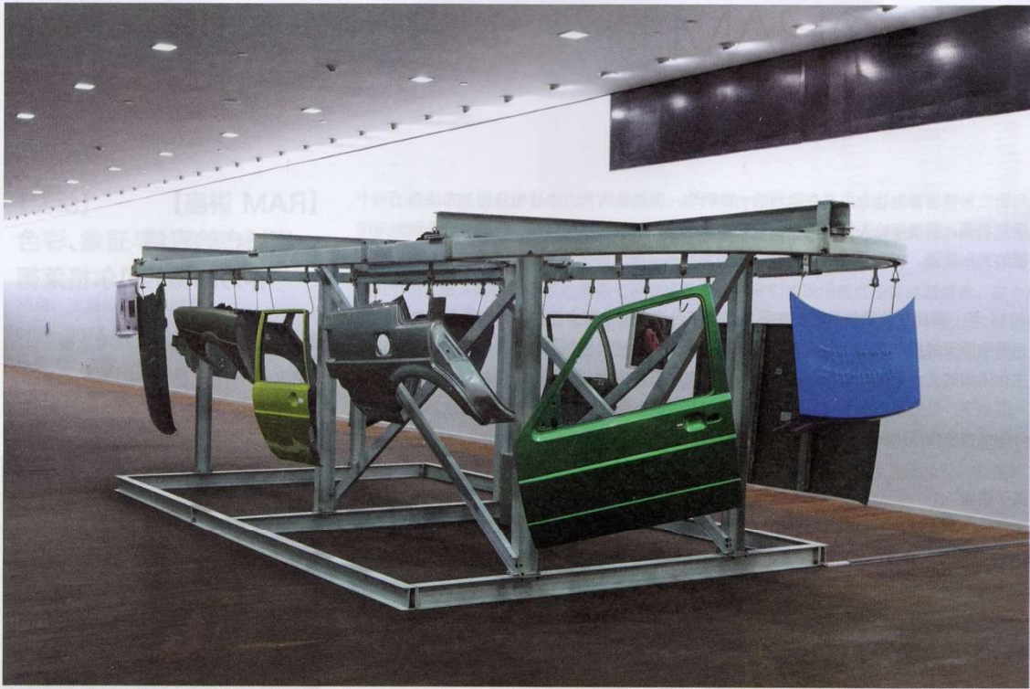
颜磊, 《有限艺术项目》, 综合材质, 尺寸各异, 2014, 上海二十一世纪民生美术馆 | 图片提供