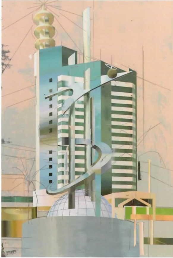
《S型房子#2》，2015年，布面油画，200cm × 150cm。

女艺术家崔洁是今天绘画领域少数着眼于探求城市规划与历史演变，集体与个体记忆相互关联、彼此影响的一位。崔洁1983年生于上海，现生活工作于北京，她的绘画作品因其凌厉厚实的笔触、具有雕刻感的颜料图层而富于在同代人中少有的表现力。她从导演奥森·威尔斯的电影里借鉴了空间的拼贴，对今日中国城市的构造进行了大胆的拆解和猜想。她捕捉的北京或者上海城市的局部，既不是忠实的肖像，亦非建筑的图解——它们充满了个体对空间经历、记忆的回应，对城市肌理的主观描写。崔洁近期的作品从回顾日本“新陈代谢派”对外的影响与辐射，到细嚼中国本土景观和城市雕塑与建筑规划的长久关联。