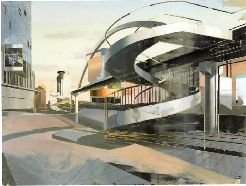
《双井桥的天桥》，2014年，布面油画，150cm × 200cm。