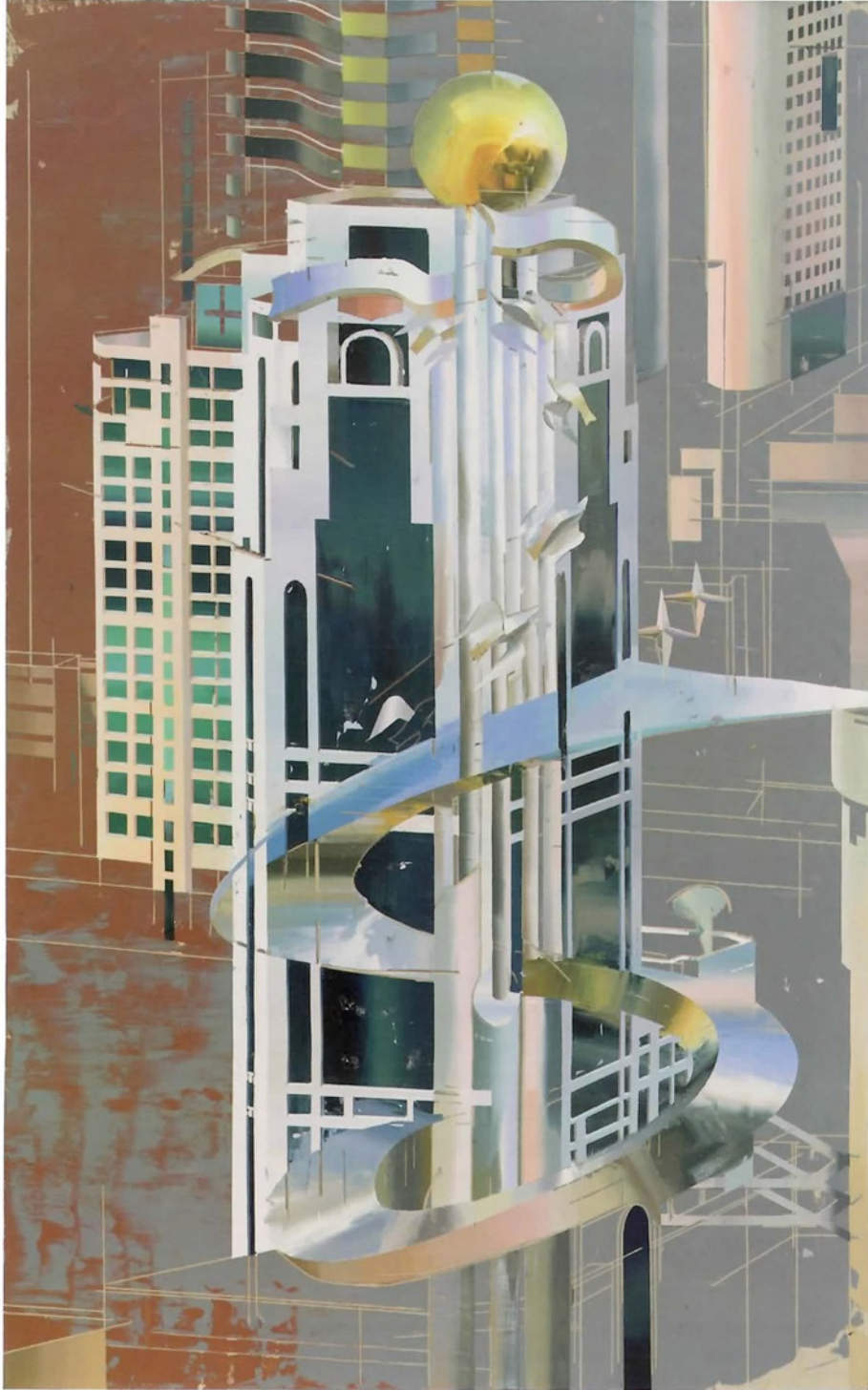
《S型房子 #3》，2015年，布面油画，220cm × 150cm。