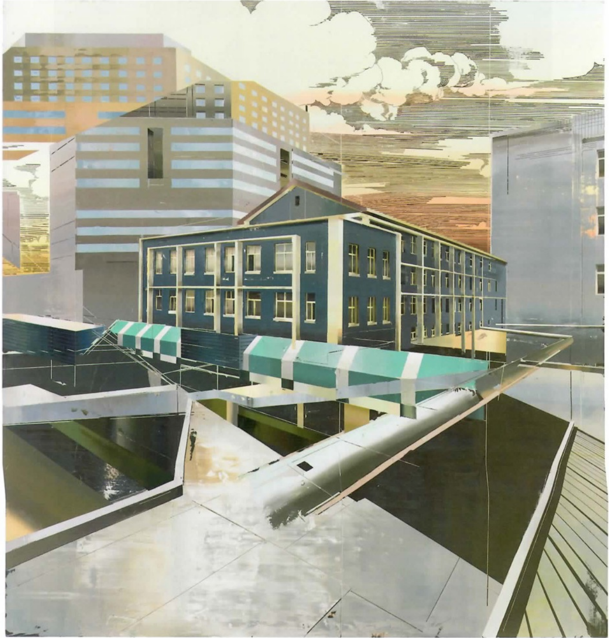
《兆维大厦》，2014年，布面油画，200cm x 190cm。