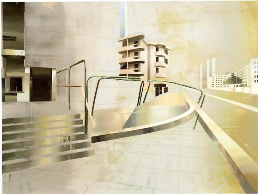
《带地下停车场的居民楼》，2014年，布面油画，150cm x 200cm。