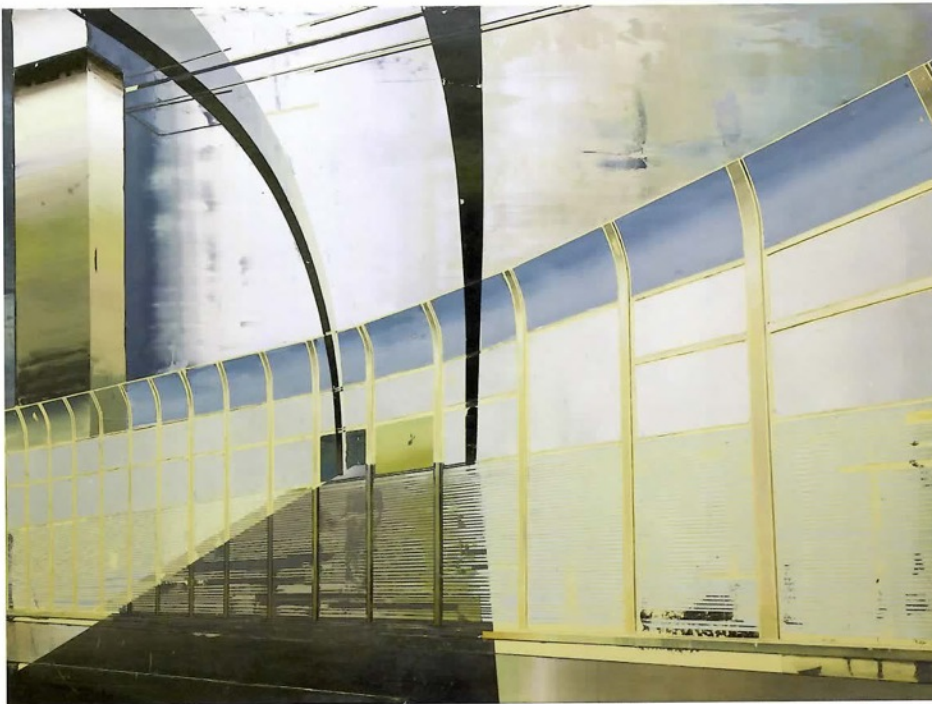
《隔音板和天桥》，2012年，布面油画，110cm × 150cm。