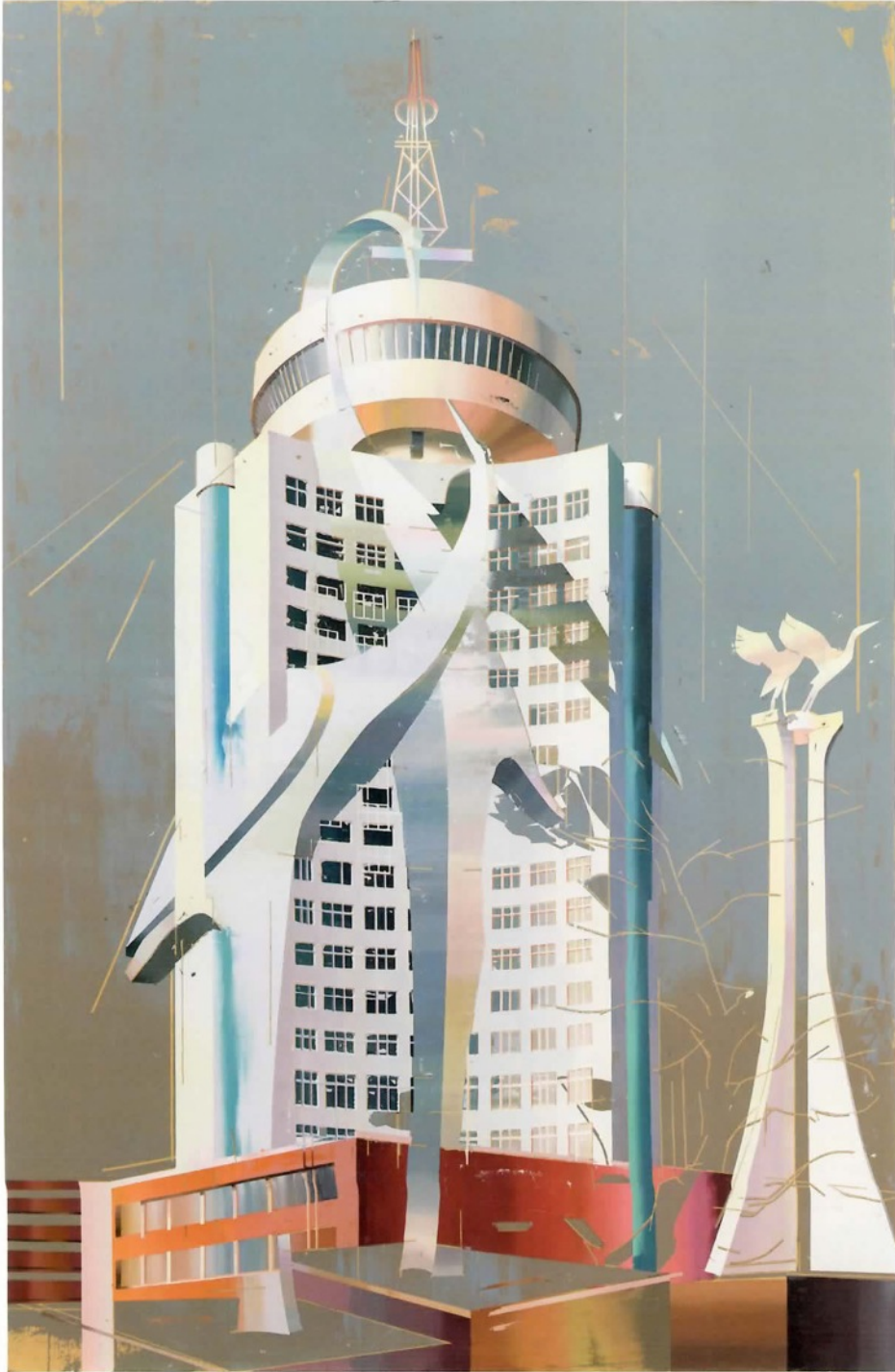
《仙鹤的房子 #4》，2015 年，布面油画，230cm x 150cm。