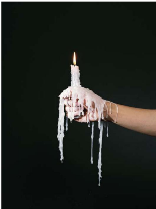
《他在夜里撞上了灯柱》 2010