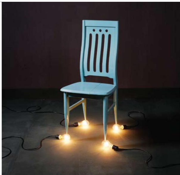
《一把椅子和四只100瓦灯泡》 2010

陈维第一次运用室内空间是在某次朋友的搬家过程中，他阴差阳错地得到了一个破落的小房间。在这居中方正的狭小方寸间，陈维突然找到了话匣子，他不再需要通过游走在城市或者郊野搜寻奇妙超现实的瞬间，不要需要一种近乎行为表演性的语言为自己的摄影添加当代的口音。而这时他反变得滔滔不绝。在废旧逼仄的房舍内，陈维领我们相继走进一个接一个Luis Bunuel式的故事桥段。这也许是一个明媚的午后，阳光投射进蜜蜂蜗居的陋室内，一名小城青年，抑或者，一名年轻的小号手，坐在板凳上专心地解开纽扣，默默地检查起胸口(《广