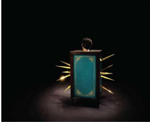
《我始终追赶着彩虹》 2011