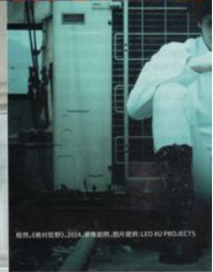
程然,《绝对狂想》,2014,摄影剧照,图片提供:LEO XU PROJECTS