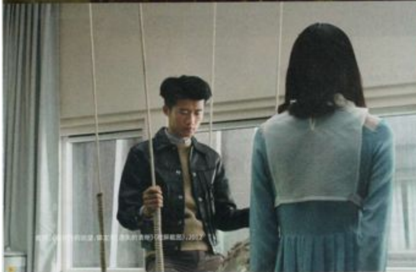
程然,《绝对狂想》,2014,摄影剧照,图片提供:LEO XU PROJECTS