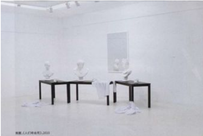
周敏,《人们将如何死》,2000