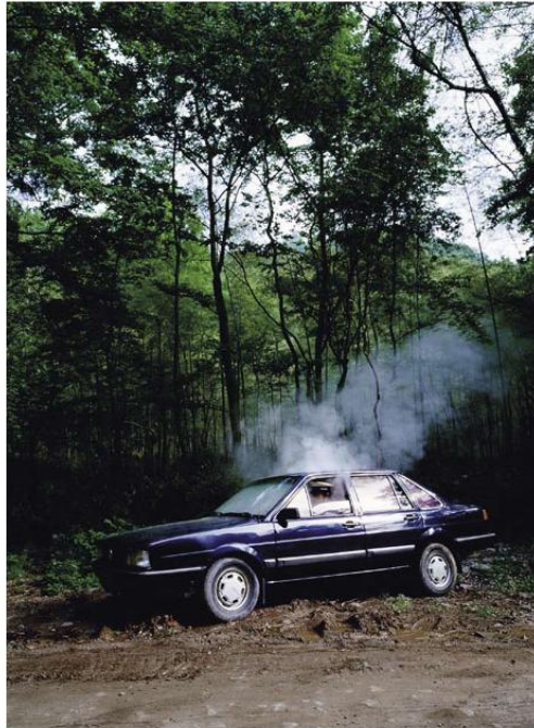
《泥浆之一》(Mud No.1), 创作于2006年