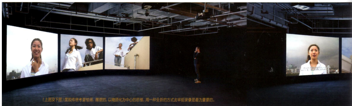
(上图及下图)摆脱传统考量绘画、雕塑的,以物质化为中心的思维,用一种全新的方式去审视录像是最为重要的。