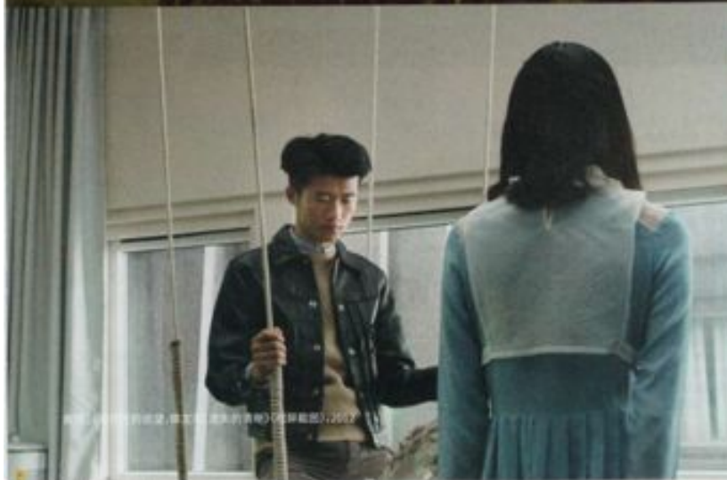
程然,《绝对狂野》(陆然执导) (导演:陆然)