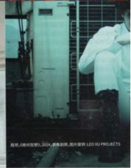
程然,《绝对狂野》,2014