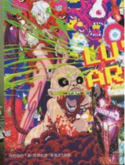
陆然,《绝对狂野》(陆然执导) (导演:陆然)