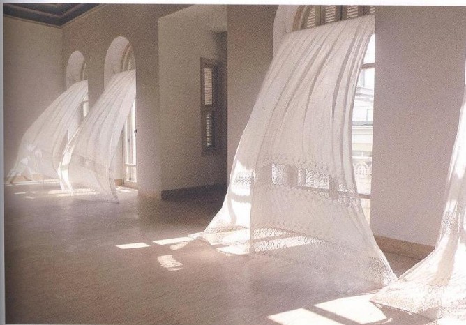
莱斯特 2011 年作品《阿卡迪亚的忧郁症》

莱斯特的作品常与人们对世界的认知方式有关，试图打破人们对外部世界的刻板印象。许多影视作品中，用电影院中映在观众脸上的灯光和背景声音的变化表示在“看电影”，但莱斯特用《怎么行动》抽离了“灯光声音变化”与“看电影”之间的象征关系。在这件作品中，光影变化只是单纯的光影变化而已。同样，第一次看到《阿卡迪亚的忧郁症》一作照片的人，看到窗帘飘动，会自然地想到“风”。但实际上掀起布幔的不是风，而是艺术家特意使用的织物硬化剂。莱斯特的作品迫使观众放空既定认知，用发现的目光看待每一个貌似日常的元素。为了避免交流错位，这次民生美术馆中展览的三件作品都不涉及过多地域性背景知识，而是注重激发人性共通的感官体验。“这三件作品都可以以很深刻、哲学的方式解读，同时也可以以娱乐的方式观看。一个小孩，或者一个95岁的老哲学家都可以找到有趣的点。比如，你刚认识一个人的时候，要谈论彼此都理解的话题；等互相熟悉之后，了解了对方的语言习惯，就可以进行更复杂的交流。所以，这几件许宇选择的作品，可以作为我和中国之间对话的一个很好的开篇。”