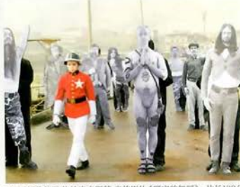
60 亚历桑德罗·佐杜洛夫斯基 自传影片《现实的舞蹈》, 片长130分钟, 2013年

“2013年在威尼斯双年展主展区看完现场有种无比的嫉妒和惊叹！对数字媒体和科技所代表或者改变的视觉文化和叙述方式有非常精准的体现，细到独白和音乐都是这个时代的选择也是极好的制作。”