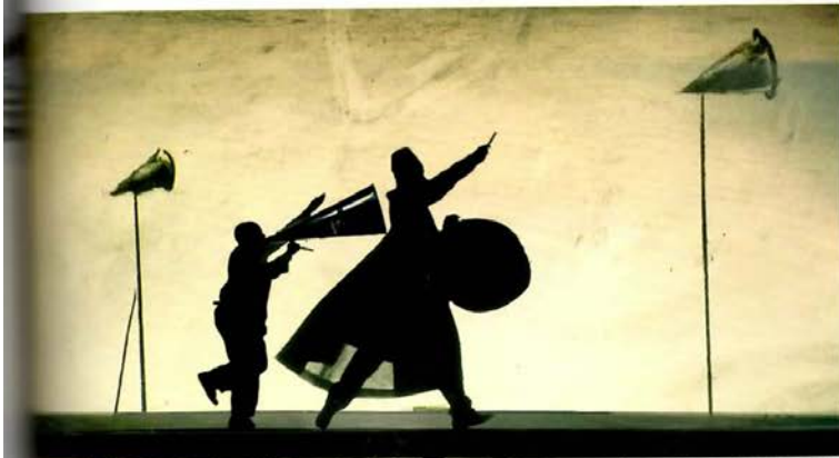
58 威廉姆·肯特瑞吉 (William Kentridge) 《时间的拒绝 (The Refusal of Time)》, 28分钟视频影像, 2010年