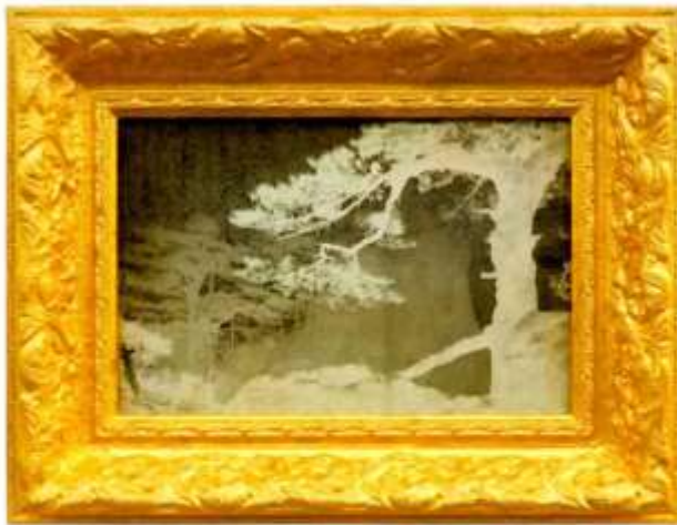
Pine Trees in Mount Huang 翠意松 画 Mixed Media/综合材料 43 x 56 x 5.5 cm 2013

另外一个连续性是跟本身是两个图像之间的关系，窗子本身是一个实物，尤其这次作品更强调窗体和窗外的关系。我以前是强调这幅画和那幅画的关系（可以理解为左边和右边的关系），这次强调的是窗体和外面的关系。我创作的都是以老上海为题材的窗子外景，窗子也就普通老百姓家里的窗子，但外面的风景是很典型的上海本地西欧式的建筑，它看似和窗子距离很近，实际上文化的距离差得很远，地方文化的强调也是和以往作品不一样的地方。