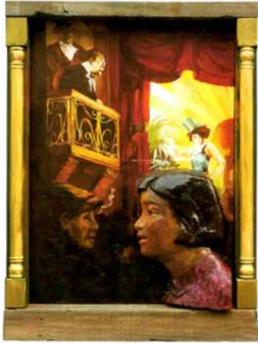
上： Reincarnation - Two Women (Part C) 转世记·两个女人(C部分) Mixed media综合材料 95.5 x 72 x 9.5 cm 2013

这是这次展览作品产生的一个考量背景，即中国现代主义运动中的世界主义倾向，也可以说是一种西方化运动。选取这个语境也和展览场所Leo Xu Projects的地理位置有关，它所在的区域是上海的旧法租界区，而上海是中国都市现代主义的发端地和典型。展览中最重要的系列《邻窗》中的建筑局部分别来自上海半殖民地时期的汇丰银行大楼和社会主义初期的中苏友好大厦（上海展览中心），代表了曾经主导中国走向的资本主义和社会主义两种路线，实物的旧窗和玻璃后的绘画造成一种邻窗相望的错觉，这虚拟的相邻相望将微观的日常生活和宏观的历史联系起来，也将一种带着陈迹的个人记忆带入关于城市历史的叙述中。