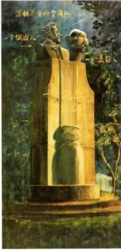
上: Poets, party and me 诗人、派对和我 Carving and oil on wood board 木板雕刻和油画 156.8 x 99.5 cm & 184.7 x 89.5 cm 2013