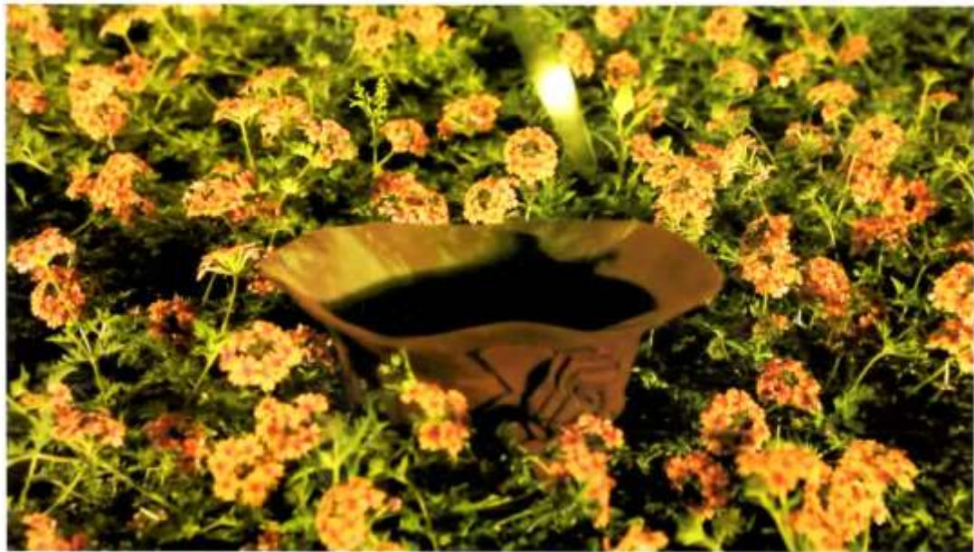
下： The Crown of Wind and Dust 风尘之冠 Single channel video 单频道影像 6'05" 6505秒 2012