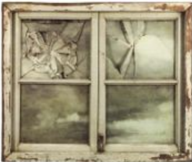
07 窗台上的窗 / The Tilt-Tile Window 2011