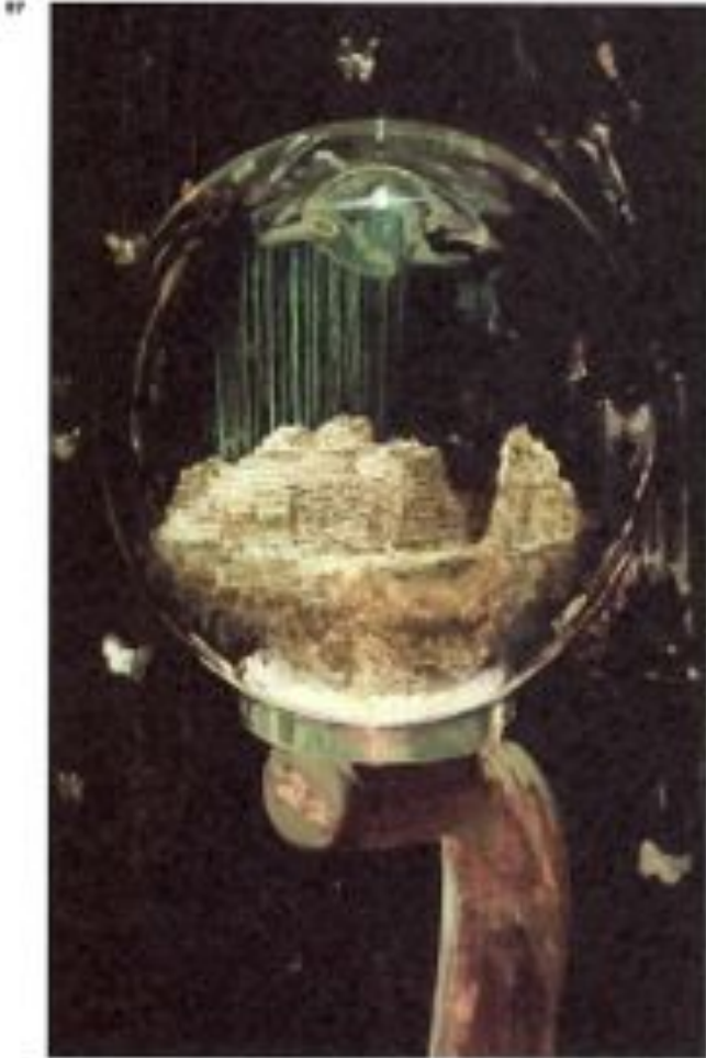
04 圆木球 / Trained Pagoda in a Globe 240x150cm 2011.4-2012.7