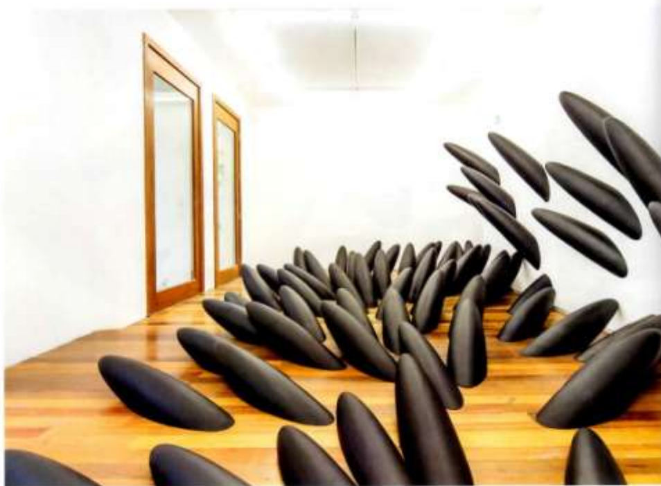
▲ 作品《仿山水》。这是阿角用电脑计算出来的景观，他选了一个运动中的算法，取静帧，做出现实中的形象，作品如同黑色触手，但其实软如海绵。